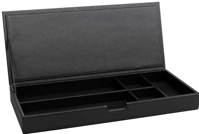
190062 - THE LONDONER, taupe 190088 - LONDONER NOIR, schwarz-black

Utensilienbox mit 5 Fächern und abklappbarem Deckel Stationary Box with 5 compartments and hinged lid