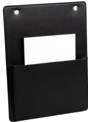
190018 - THE LONDONER, taupe 190079 - LONDONER NOIR, schwarz-black

Info-Wandhalter z.B. für Wäscheservice Service Wall Holder e.g. for laundry information