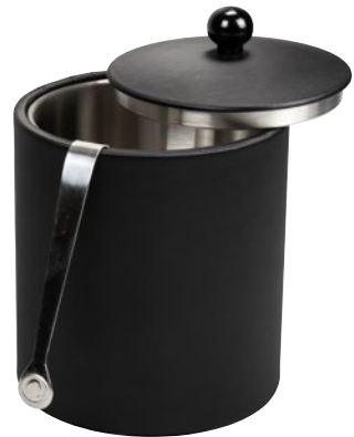
190006 - THE LONDONER, taupe 190051 - LONDONER NOIR, schwarz-black

Eiswürfelbehälter, 1 Liter mit Deckel und Zange. Edelstahl Ice Cube Container, 1 litre with lid and tongs. Stainless steel