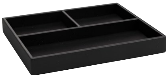
190009 - THE LONDONER, taupe 190072 - LONDONER NOIR, schwarz-black

Utensilienbox mit 3 Fächern Stationary Box with 3 compartments