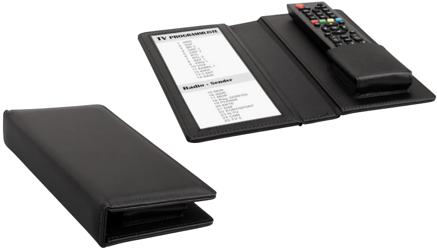
190014 - THE LONDONER, taupe 190076 - LONDONER NOIR, schwarz-black

TV-Mappe mit Fach für Fernbedienung und Sichtfenster für Programmliste