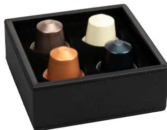
190065 - THE LONDONER, taupe 190091 - LONDONER NOIR, schwarz-black

Kapselbehälter mit wendbarer Einlage für 2 oder 4 Kapseln Coffee Capsule Box with reversible insert for 2 or 4 capsules