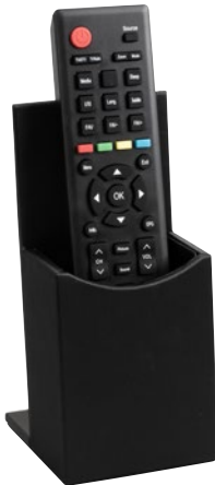
190015 - THE LONDONER, taupe 190077 - LONDONER NOIR, schwarz-black

Fernbedienungsständer Remote Control Holder