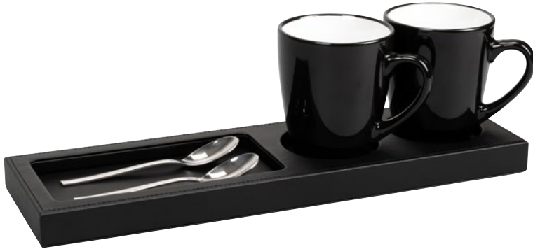
190063 - THE LONDONER, taupe 190089 - LONDONER NOIR, schwarz-black

Glas-/Tassenuntersetzer für Gläser/Tassen/Teebeutel Coaster for cups/glasses/tea bags