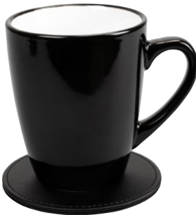
190004 - THE LONDONER, taupe 190071 - LONDONER NOIR, schwarz-black